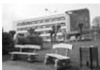
1. att. Viesnīca